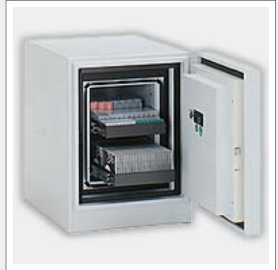
Abbildung zeigt Modellbeispiel und kann bereits kostenpflichtige Zusatzausstattung enthalten.