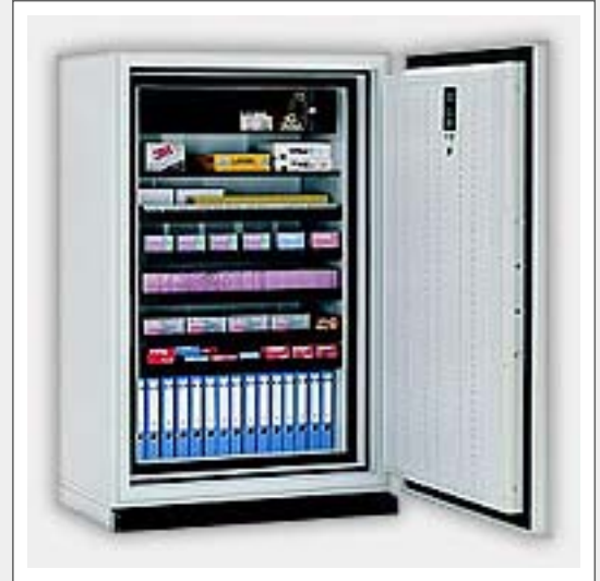
Abbildung zeigt Modellbeispiel und kann bereits kostenpflichtige Zusatzausstattung enthalten.