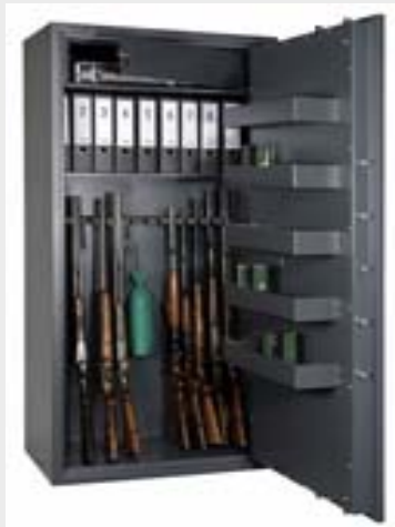
Foto Nr. 92: Waffen gehören in hochwertige Waffenschränke, die von der ESSA nach der Europäischen Norm EN 1143-1 zertifiziert sind. Das Risiko eines Missbrauchs ist sonst zu hoch.

ESSA und VDMA fordern strengere Gesetzgebung für die Aufbewahrung von Schusswaffen