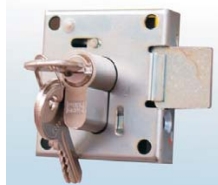
Schlosskasten mit Profilhalbzylinder anstatt Elektronikschloss