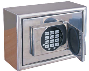
Art.-01500 inkl. Elo-Schloss Schlossabdeckung geöffnet Spritzwasser- und Feuchtigkeitsschutz