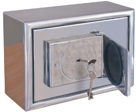
Art. 01503 mit DB-Schloss