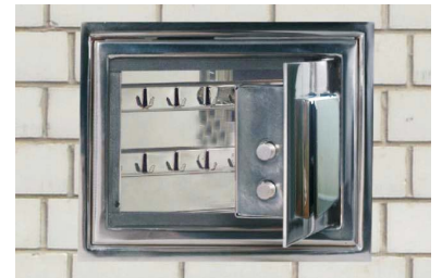
Art.-01501 eingemauert geöffnet