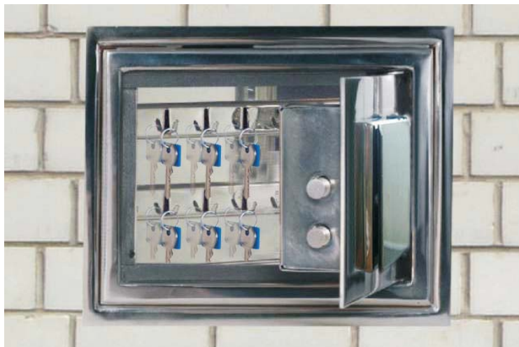
Art.-01501 eingemauert geöffnet

Durch die Abdeckung mit der Gummidichtung und dem Haltemagnet ist die Tastatur optimal gegen Spritzwasser und Feuchtigkeit geschützt.