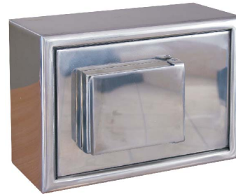
Art.-01500 mit Schlossabdeckung Spritzwasser- und Feuchtigkeitsschutz