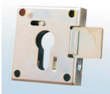
Schlosskasten für Profilhalbzylinder anstatt Elektronikschloss

Durch die Vorrichtung mit Schlosskasten für Profilhalbzylinder anstatt Elektr.-Schloss können Sie den Schlüsselaufbewahrungsbehälter in Ihre bestehende Schließanlage integrieren.