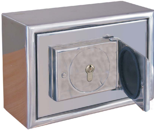
Art. 01507 mit PHZ Schloss

für den Außen- und Innenbereich an die Wand geschraubt oder in die Wand eingemauert.