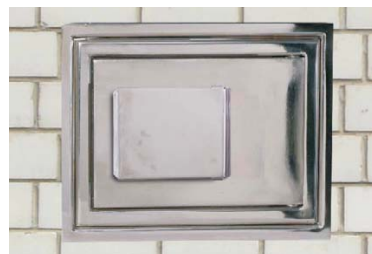
Art.-01501 eingemauert geschlossen