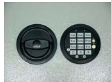
Art.-Nr. 35921 + 35922