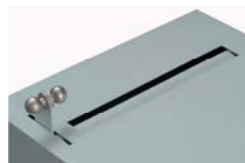
nach Einwurf Wertsache Hebel loslassen