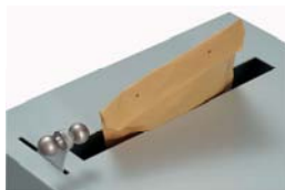
Hebel heranziehen Schachtfreigabe

Funktionsweise : Durch Betätigen des Hebels nach vorn wird der Einwurfschacht geöffnet . Nach Einwurf des Gutes wird der Hebel freigegeben und das Verschließblech schließt automatisch die Schachtöffnung und das Gut fällt in den Innenbereich des Safes .