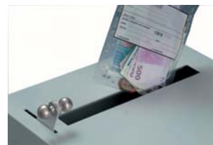
Schachtöffnung mit Bedienhebel

Einwurfmechanismus siehe Skizze auf Rückseite