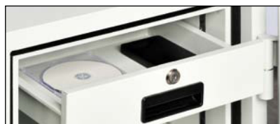
Schublade - serienmäßig bei Torino 3-6

* Durch die vorstehenden Beschläge erhöht sich das Außenmaß in der Tiefe um 48 mm