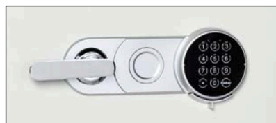
Elektronisches Tastenkombinationsschloss (Standard)