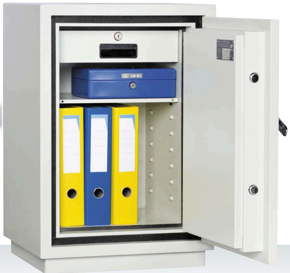
Abbildung zeigt Torino 3