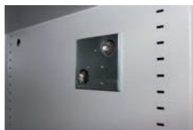
Vorbereitung für eine Alarmkomplettausstattung