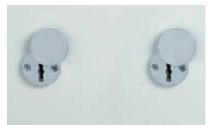
Grundausrüstung: 2 x DSS mit Schlüsselrosette (Standard)